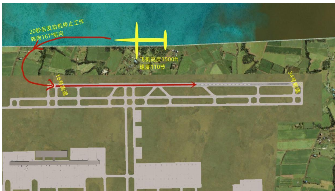
(图中飞机位置仅供参考，以配置文件中飞机位置为准)