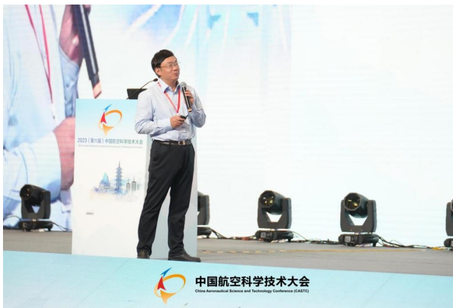
图 7 李应红院士做大会报告