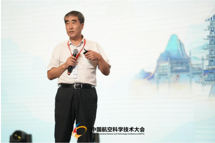
图 10 宫声凯院士做大会报告