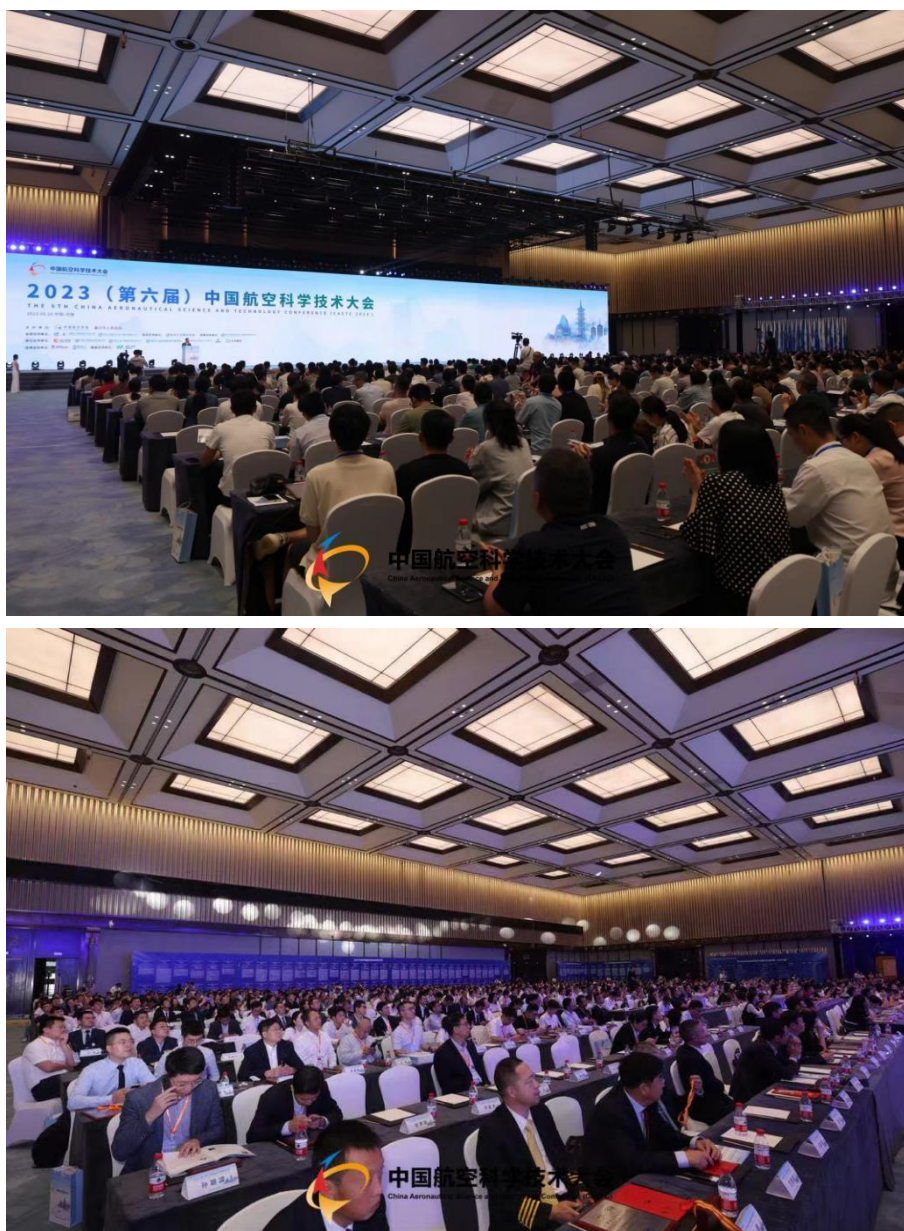
图 1 大会现场

2023 年 9 月 26 日，2023（第六届）中国航空科学技术大会在乌镇互联网国际会展中心盛大开幕，大会为期 3 天。