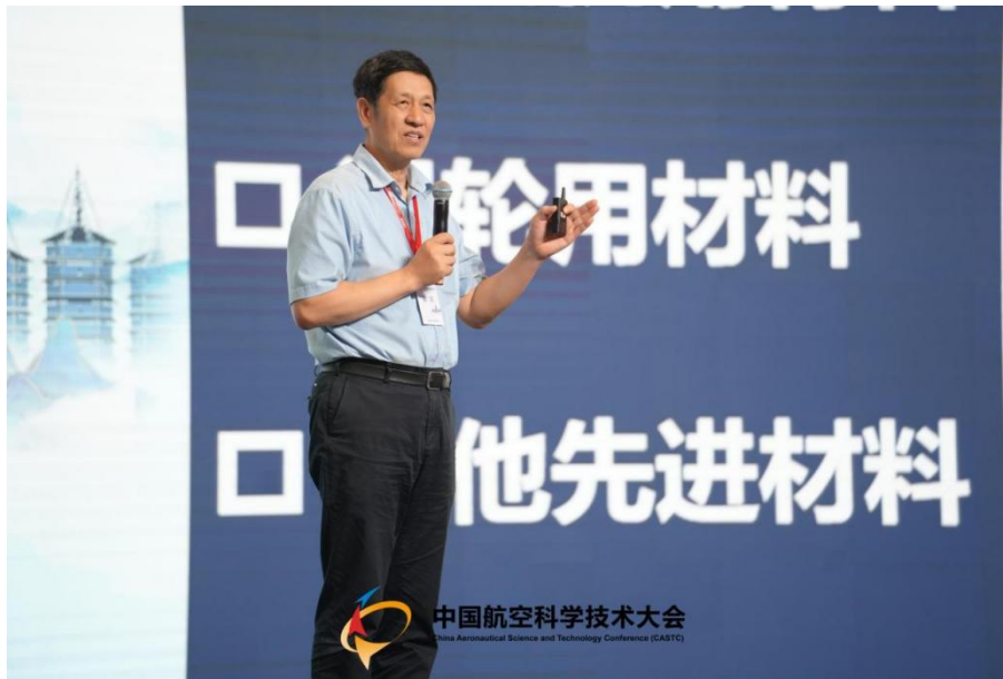
图 6 徐惠彬院士做大会报告