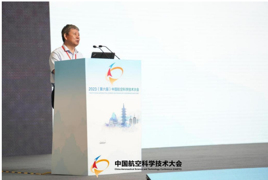
图8 樊会涛院士做大会报告