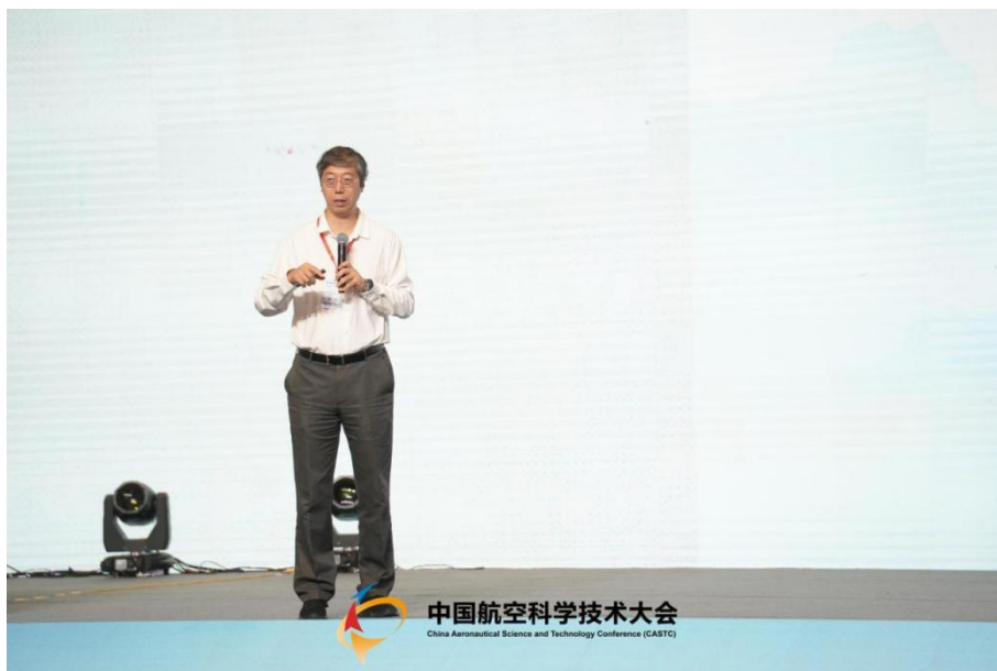
图 12 冷劲松院士做大会报告