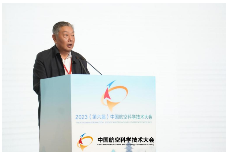
图 2 中国航空学会林左鸣理事长致开幕辞

中国航空学会林左鸣理事长、嘉兴市人民政府李军市长分别为大会致辞，学会副理事长兼秘书长姚俊臣主持开幕式，共有 13 位两院院士、百余位行业总师、1500 余位航空科技工作者参加会议。