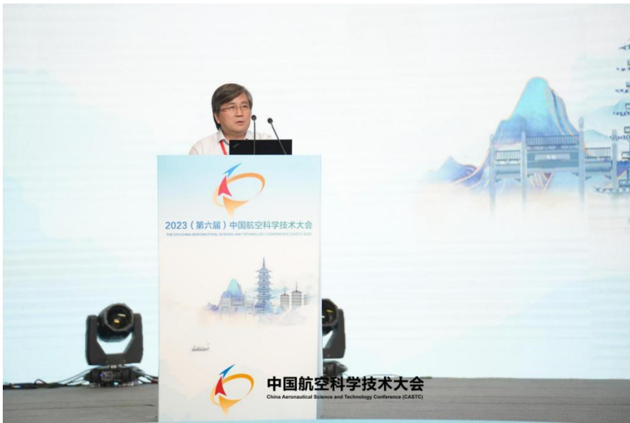
图 11 王自力院士做大会报告