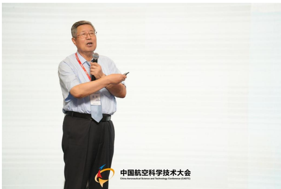
图9 闫楚良院士做大会报告